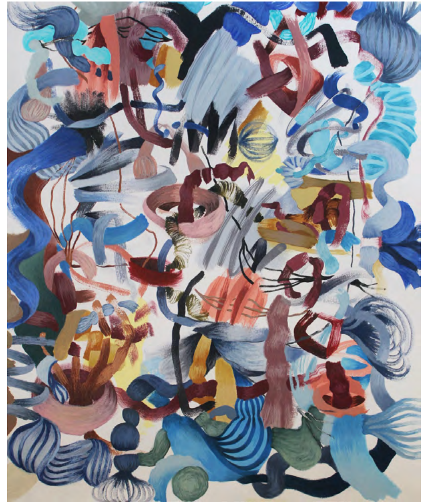
S/T - Serie Primavera