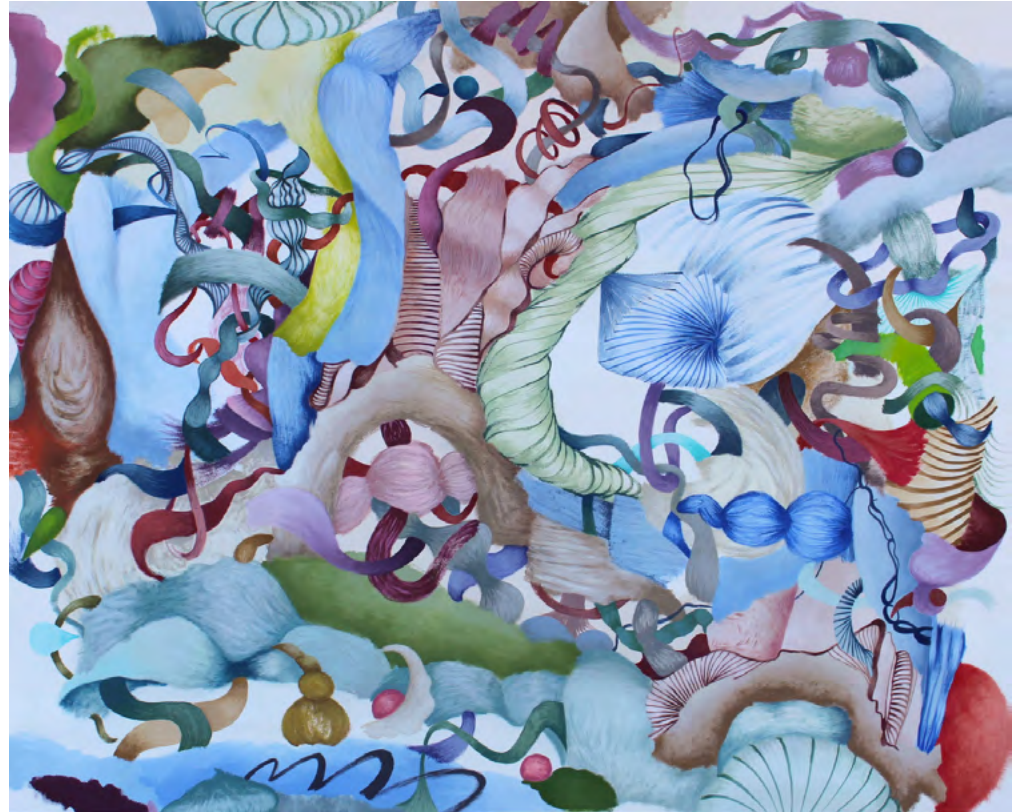
Paisaje nº 6 Serie Memoria de un paisaje