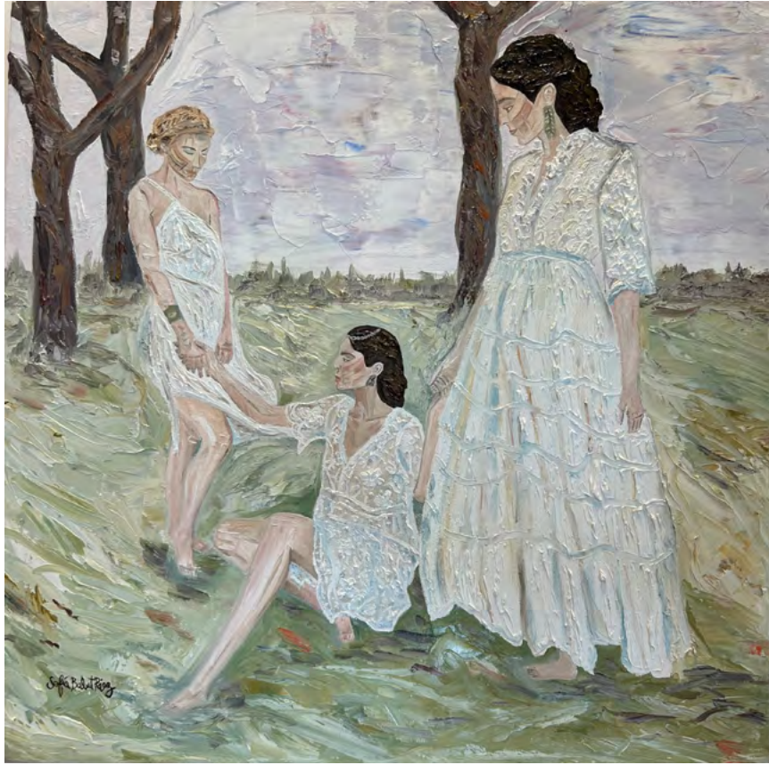
La unión de las tres gracias