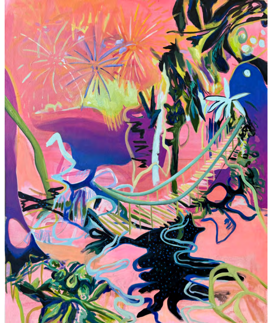
Ríos de lava en la selva II

Acrílico y Óleo sobre tela 120 x 100 cm 2025