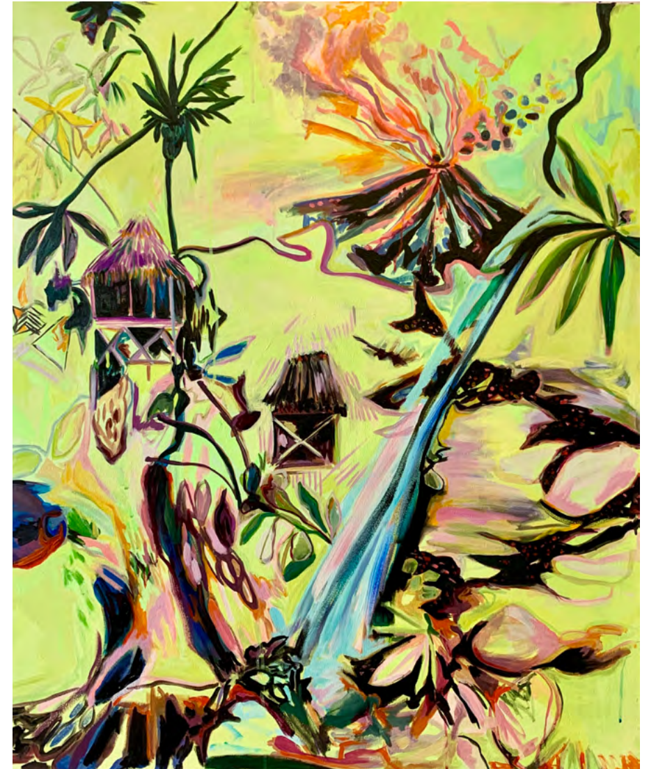
Ríos de lava en la selva I

Acrílico y Óleo sobre tela 120 x 100 cm 2025