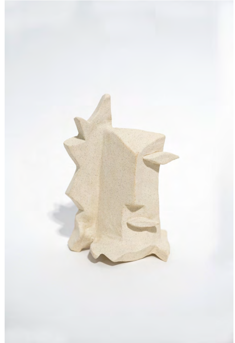
Así me quedo