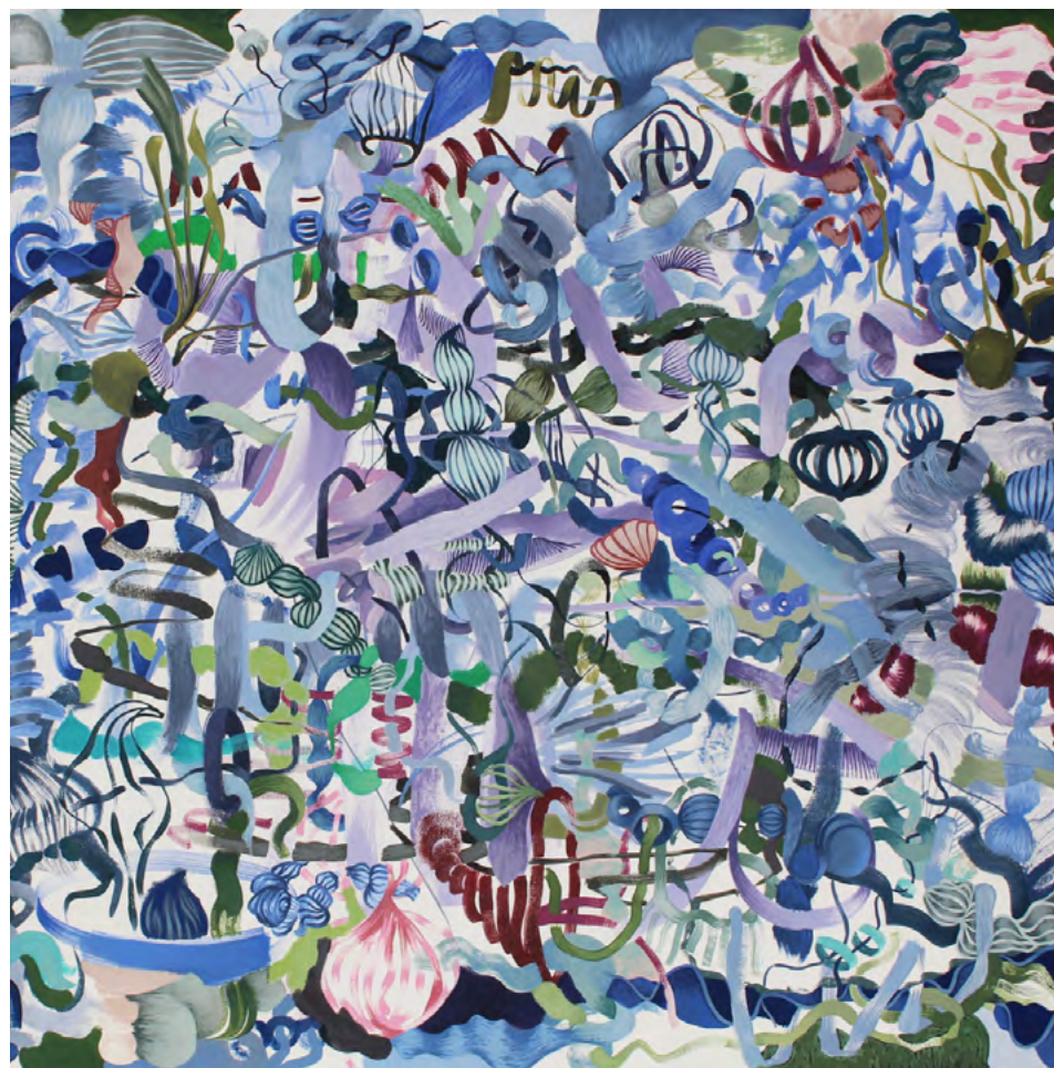
Floral - Serie primavera