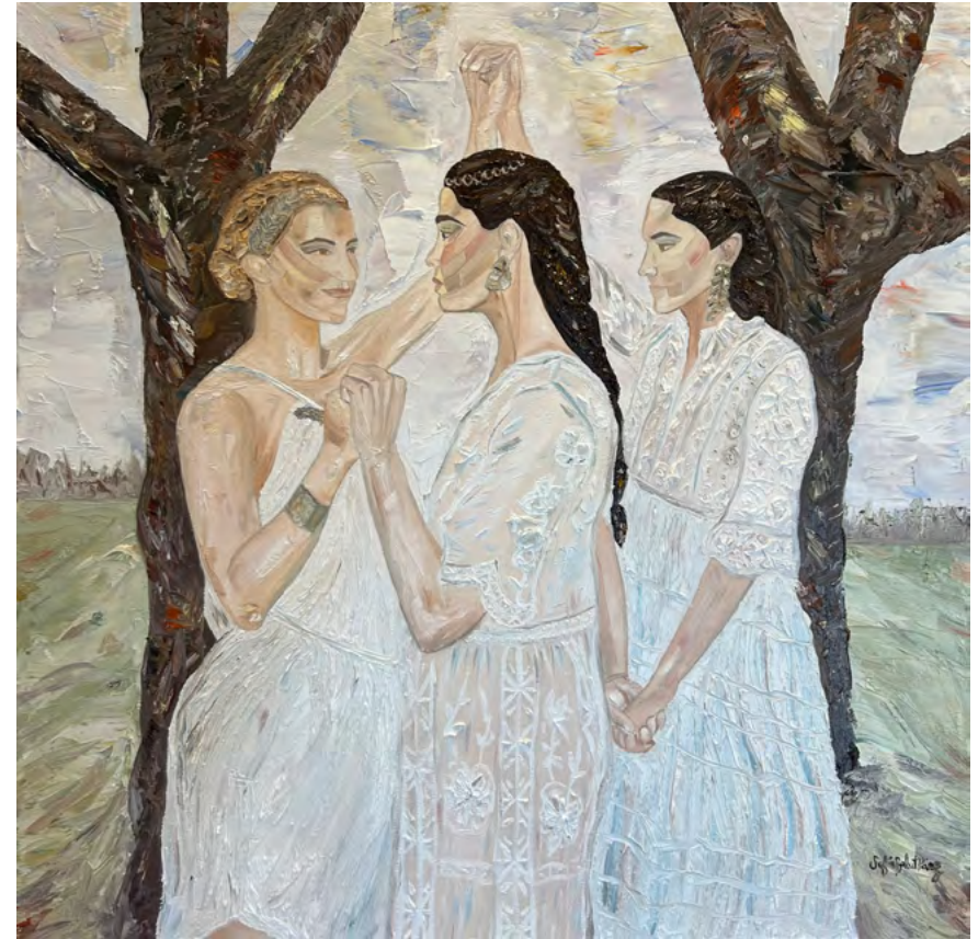
Las tres gracias