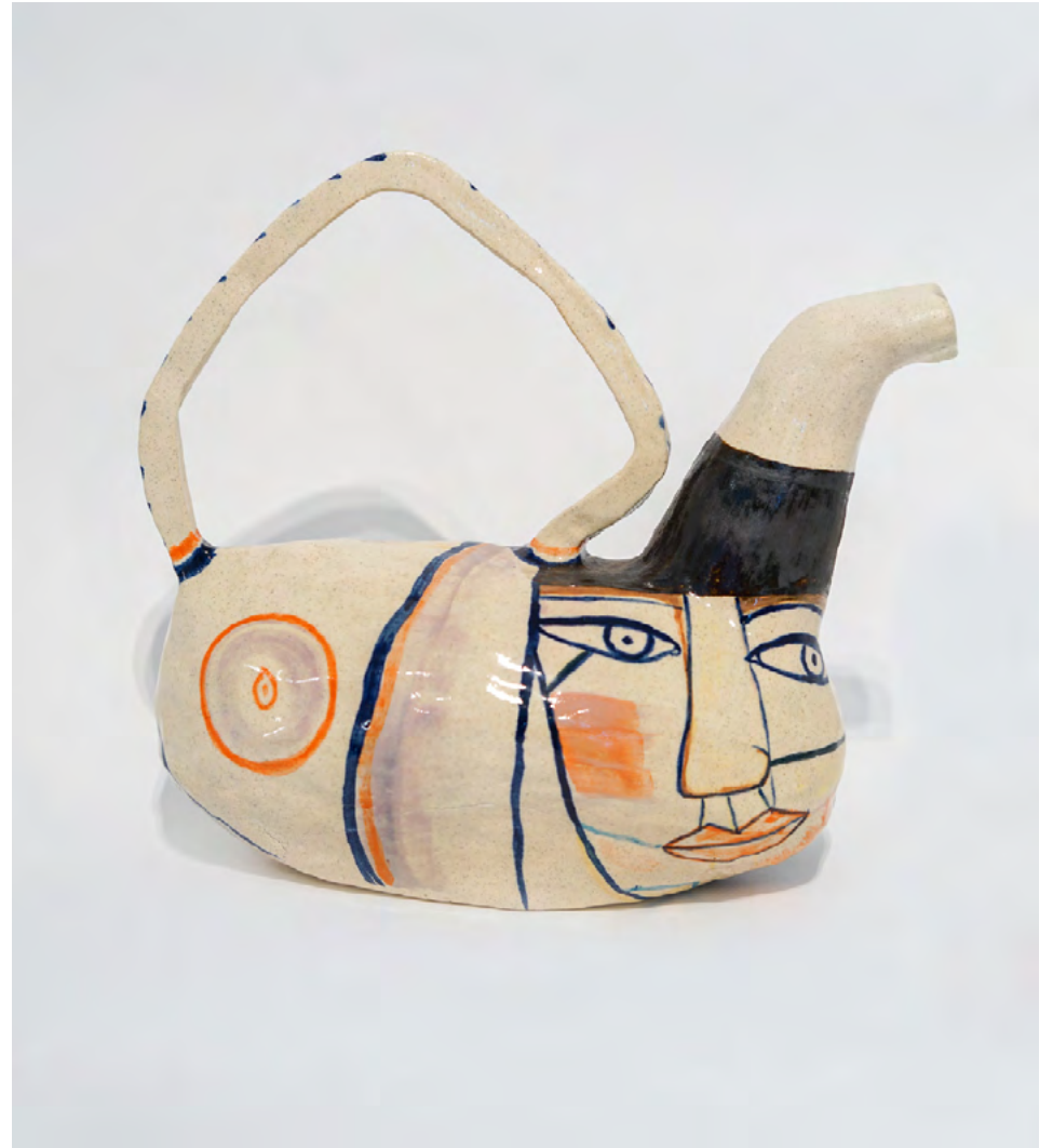
Tamara a la espera