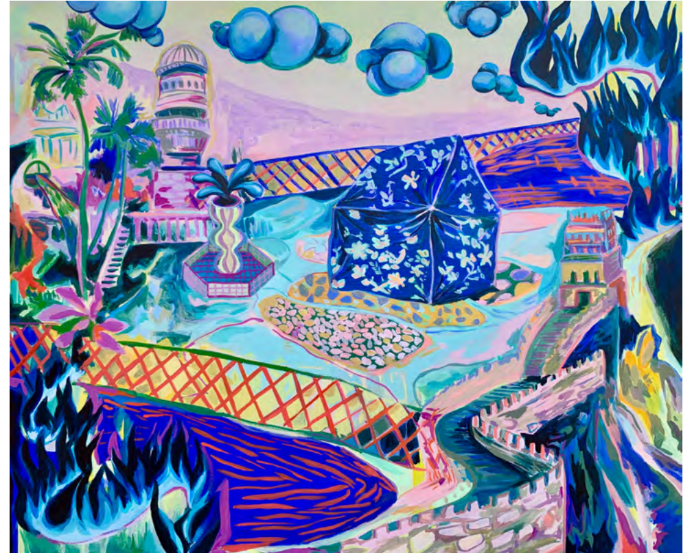
De acampar en la muralla china

Acrílico y óleo sobre tela 55 x 65 cm 2023